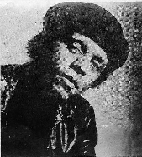
1. Garland Jeffreys: 11.00 - 12.00 uur podium rechts