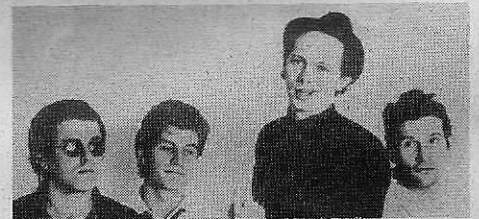
3. JOE JACKSON BAND: 13.30 - 14.30 uur/ podium rechts